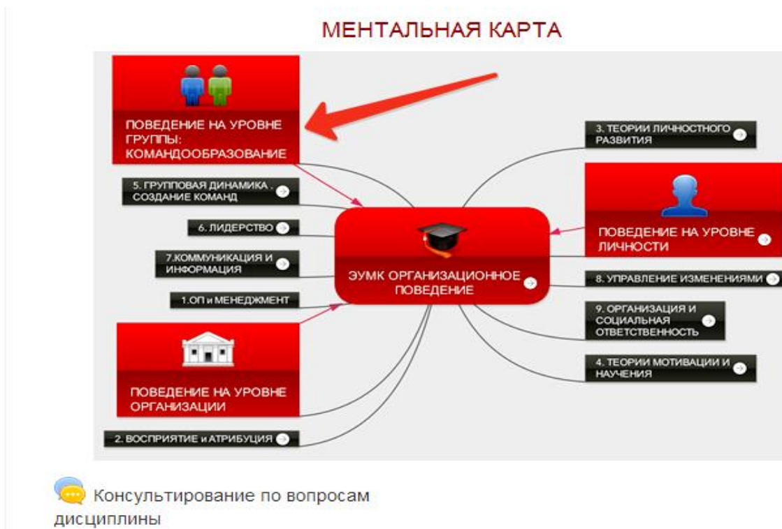
Рисунок 1 – Скриншот главной страницы курса «Организационное поведение». Ментальная карта

На рисунке 1 показаны три основных модуля изучения дисциплины: поведение на уровне личности, поведение на уровне группы – командообразование, поведение на уровне организации. Модуль «Командообразование» состоит из трех тем: групповая динамика, лидерство, коммуникация и информация [26].